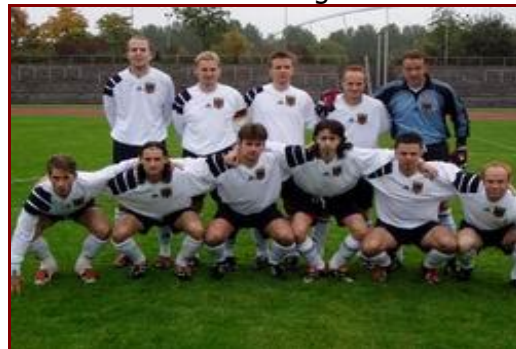
Die deutsche Mannschaft in Stuttgart